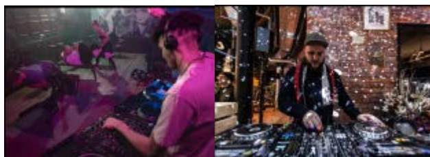
(DJによるライブエクササイズ風景)※(写真)JOHN REED ホームページより抜粋

例えば、ZUMBAであったりHIIT系の強度の高いクラスでは、ゴールデンタイムに、プロのDJの導入によるライブスタイルのクラスを提供し、クラスをあっという間にトランス状態に導き、エクササイズを超えた高揚と刺激を提供している。