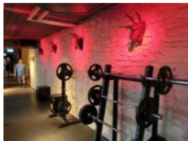
(フリーウエイトゾーンへの回廊と甲冑の凝視を受けるパワーゾーン)

ラウンジは、アジアテイストとヨーロッパテイストのアンティーク家具やライトが融合した、落ち着いた雰囲気、ここで何時間でもゆったり本を読んでいたい衝動を感じてしまう。