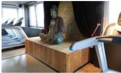
(トレッドミルゾーンの真ん中には仏像が鎮座する)