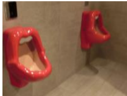
(お手洗いを覗いてみても、驚きへの期待を裏切らない)