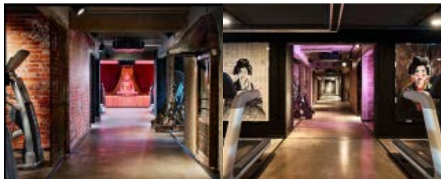
(ジャポネクスもふんだんに演出されている)